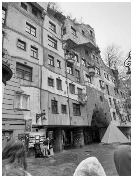
Hundertwasserhaus - Vídeň