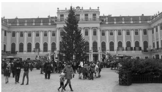
Schönbrunn - adventní trh - Vídeň