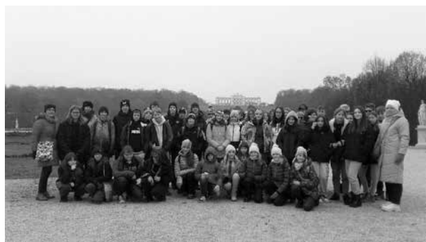
Schönbrunn - společná - Vídeň