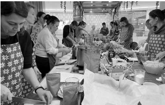
Kulinařské studio Polsko