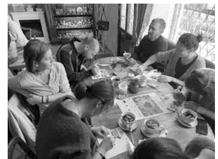
Zdobení perníků Polsko