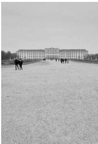
Schönbrunn - Vídeň