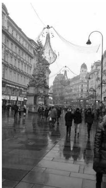
Am Graben - Vídeň