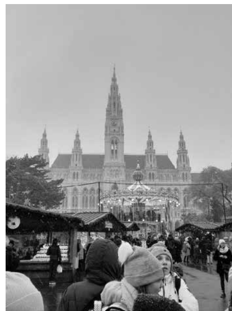
Radnice - Vídeň