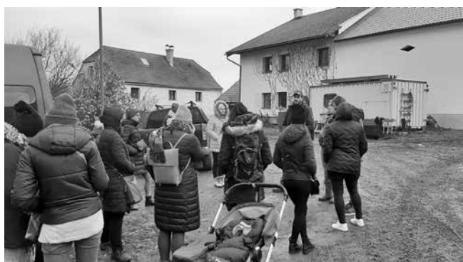
Exkurze Statek Hořenice