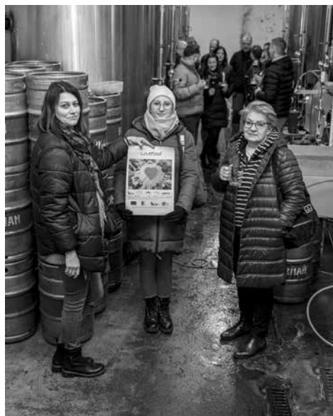
Workshop ČR PL pivovar Heřman