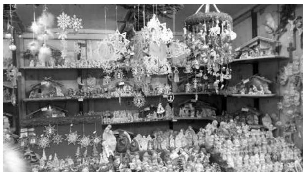
Vánoční trh - Vídeň