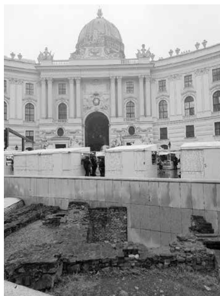
Hofburg - Vídeň