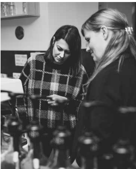
Workshop ČR PL kavárna