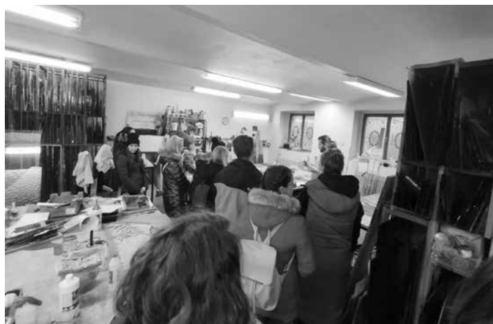
Exkurze vitrážnická dílna