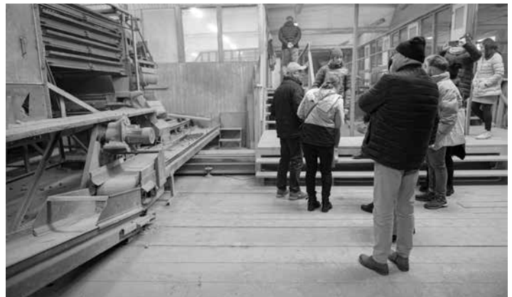
Workshop ČR PL ZOD Kámen